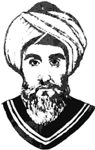
Şeyhül Ekber Muhyiddin Arabi

Nübüvvetin şeriatı ile bu gün anlatılmak istenen şeriat olarak nitelendirdiğimiz ibadetlerdir. Bunlar namaz, oruç, hac, zekât, kurban ve kelimeyi şehadettir, İslam'ın 5 şartı olarak nitelendirilir. Bu ahkâm şeri ibadetin erkânıdır. Bu erkân hakikatin görülür hali olan zahiridir. Şeri ahkâm hakikatin köprüsüdür. Namazın günde kaç vakit olduğu ve nasıl kılınacağı, orucun ne zaman nasıl tutulacağı, hac ve zekâtın nasıl gerçekleşeceği, kelimeyi şehadetin nasıl çekileceği peygamber efendimiz tarafından belirtilmiştir.